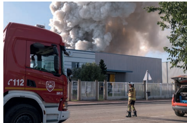
Foto tercer día de incendio - Azuqueca de Henares.

Respecto a las baterías de litio, los incendios en plantas de reciclaje y vertederos evidencian la dificultad de intervención y la elevada toxicidad de los gases que generan. Aquí la clave está más en la