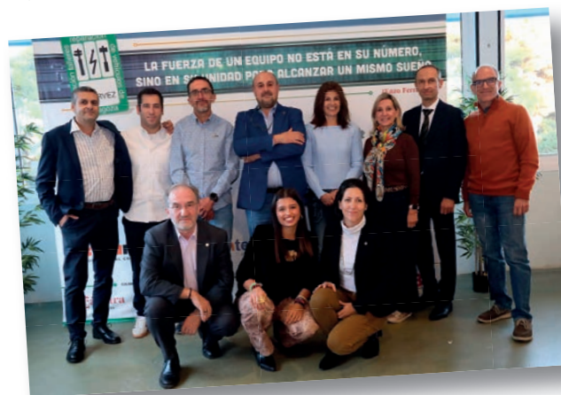
Actuales miembros de Junta Directiva y personal de Atarvez

Tras la Asamblea, todos pudieron disfrutar del parque y sus atracciones durante la mañana, así como de los espectáculos de Halloween, que llenaron el ambiente de risas y algún susto que otro.